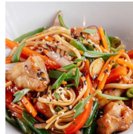
Лапша удон с курицей/с овощами 500/390 ₽ UDON NOODLES WITH CHICKEN/ WITH VEGETABLES 乌冬鸡肉/蔬菜