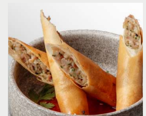
Спринг ролл с пряной свиной SPRING ROLL WITH SPICY PORK 春捲配辣猪肉