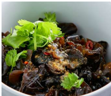
Древесные грибы в 13 специях 300 ₽ WOOD MUSHROOMS IN 13 SPICES 木蘑菇在13香料