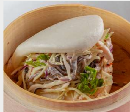
Бао с индейкой BAO WITH TURKEY 火雞包

ЕСЛИ У ВАС ЕСТЬ АЛЛЕРГИЯ НА ОПРЕДЕЛЕННЫЕ ПРОДУКТЫ, ОБЯЗАТЕЛЬНО СООБЩИТЕ ОБ ЭТОМ. VE ALLERGIES TO CERTAIN FOODS, PLEASE REPORT IT.