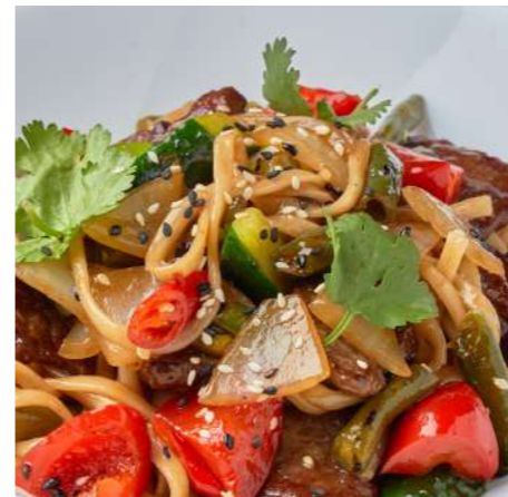
Говядина в устричном соусе с рисом/с лапшой 610 ₽ BEEF IN OYSTER SAUCE WITH RICE/NOODLES 蚝油牛肉配米饭/面条