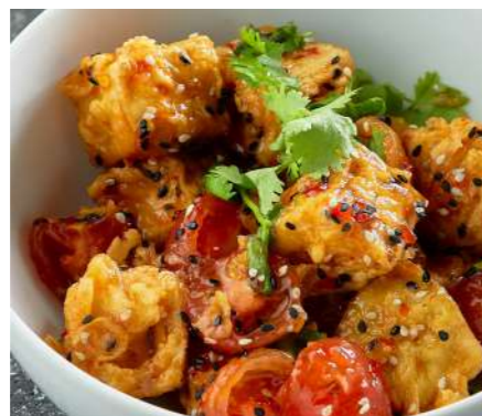
Салат с томатами и баклажанами в китайской темпуре и Sweet Chili Sauce 470 ₽ SALAD WITH TOMATOES AND EGGPLANT IN CHINESE TEMPURA AND SWEET CHILI SAUCE 西红柿和茄子沙拉在中国天妇罗和甜辣椒酱