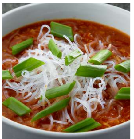
Томатный суп с яйцом 390 ₽ TOMATO SOUP WITH EGG 鸡蛋番茄汤