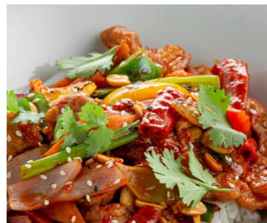
Курица Кунг-Пао 550 ₽ KUNG PAO CHICKEN 宫保鸡丁