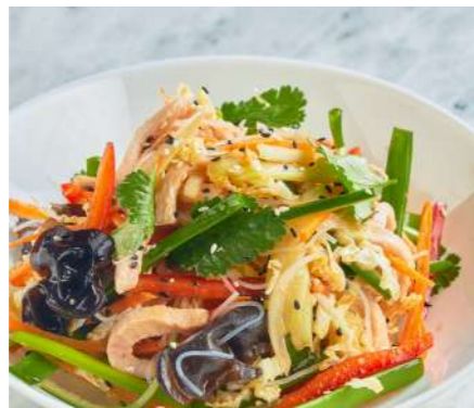
Салат Харбин с индейкой 400 ₽ HARBIN SALAD WITH TURKEY 哈尔滨火鸡沙拉