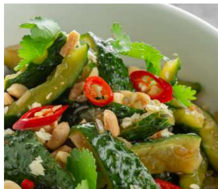
Битые огурцы с арахисом и кинзой 350 ₽ BROKEN CUCUMBERS WITH PEANUTS AND CILANTRO 碎黄瓜与PEANOC和SILANTRO