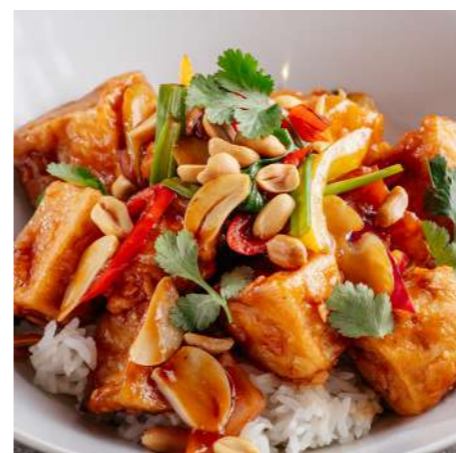
Баклажаны в кисло-сладком соусе 450 ₽ EGGPLANT IN SWEET AND SOUR SAUCE 茄子糖醋酱