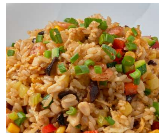
Жареный рис с курицей и креветками 520 ₽ FRIED RICE WITH CHICKEN AND SHRIMP 鸡肉大虾炒饭