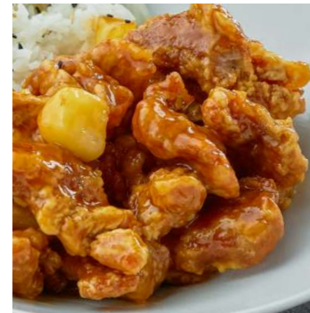
Свинина в кисло-сладком соусе с рисом/без риса 550/500 ₽ PORK IN SWEET AND SOUR SAUCE WITH RICE/ WITHOUT RICE 糖醋猪肉米饭酱/不含米饭