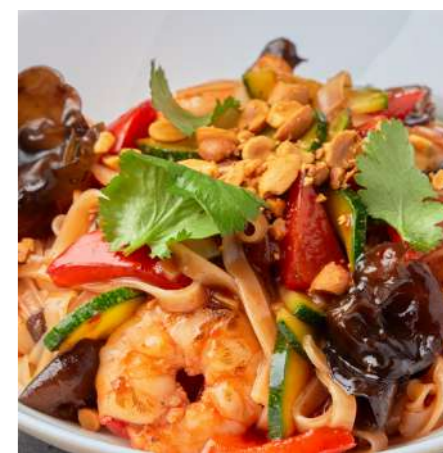
Рисовая лапша с креветками 610 ₽ RICE NOODLES WITH SHRIMP 虾米面