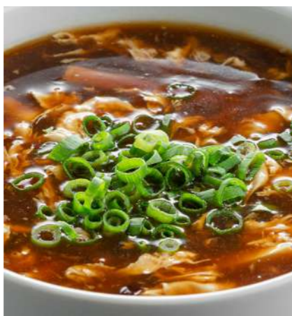
Кисло-острый суп с курицей 470 ₽ SOUR-SPICY SOUP WITH CHICKEN 酸辣鸡肉汤