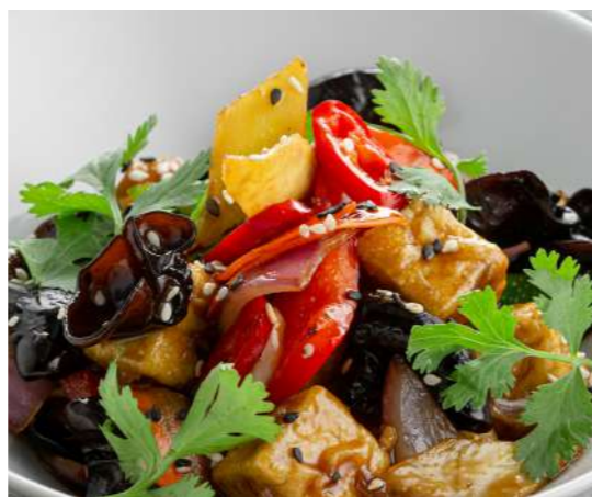
Тофу с овощами в соево медовом соусе 450 ₽ TOFU WITH VEGETABLES IN SOY HONEY SAUCE 豆腐配蔬菜 酱油