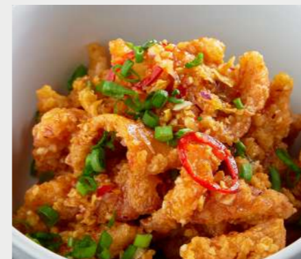
🔥 Кальмары с чесноком, 13-ю специями в Sweet Chili Sauce SQUID WITH GARLIC, 13 SPICES IN SWEET CHILI SAUCE 鱿鱼配大蒜,甜辣椒酱中的13种香料