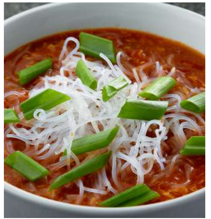
Томатный суп с яйцом TOMATO SOUP WITH EGG 鸡蛋番茄汤