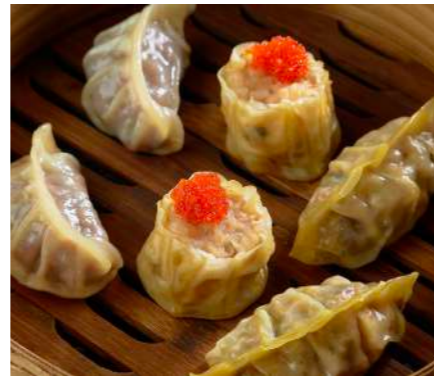
Ассорти пшеничных Дим Сам ASSORTED WHEAT DIM SUM 什锦小麦点心