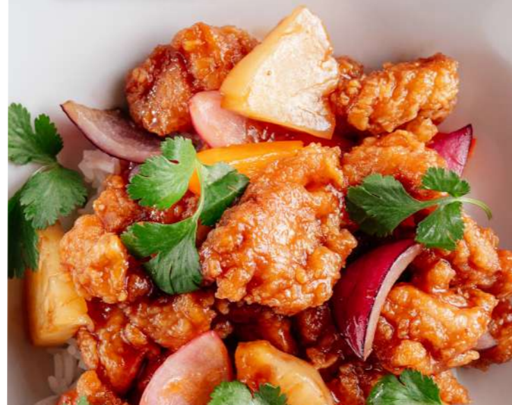
Баклажаны в кисло-сладком соусе EGGPLANT IN SWEET AND SOUR SAUCE 茄子糖醋酱