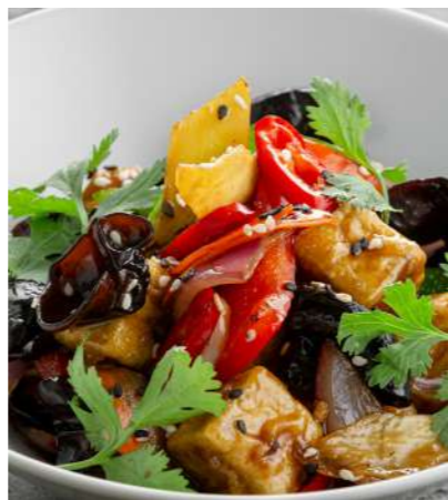
Тофу с овощами в соево медовом соусе TOFU WITH VEGETABLES IN SOY HONEY SAUCE 豆腐配蔬菜 酱油