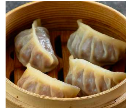
Дим Самы с говядиной, имбирем и зеленым луком DIM SUM WITH BEEF, GINGER AND GREEN ONION 牛肉点心,姜和葱