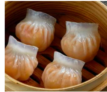
Хагао с креветкой HAGAO WITH SHRIMP 海高虾