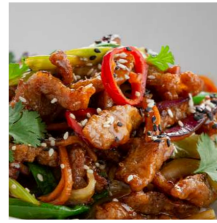
Свинина стир-фрай с лапшой/с рисом STIR-FRY PORK WITH NOODLES/WITH RICE 炒猪肉配面条/配米饭