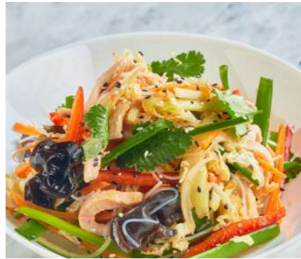
Салат Харбин с индейкой HARBIN SALAD WITH TURKEY 哈尔滨火鸡沙拉