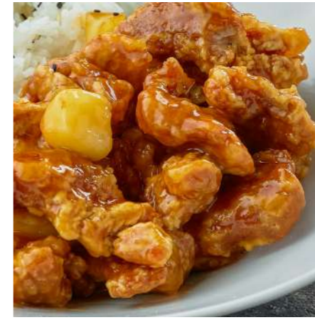
Свинина в кисло-сладком соусе с рисом/без риса PORK IN SWEET AND SOUR SAUCE WITH RICE/WITHOUT RICE 糖醋猪肉米饭酱/不含米饭