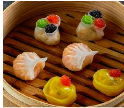
Ассорти крахмальных Дим Сам ASSORTED STARCH DIM SUM 什锦淀粉点心