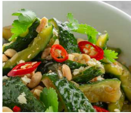
Битые огурцы с арахисом и кинзой BROKEN CUCUMBERS WITH PEANUTS AND CILANTRO 碎黄瓜与PEANOC和SILANTRO