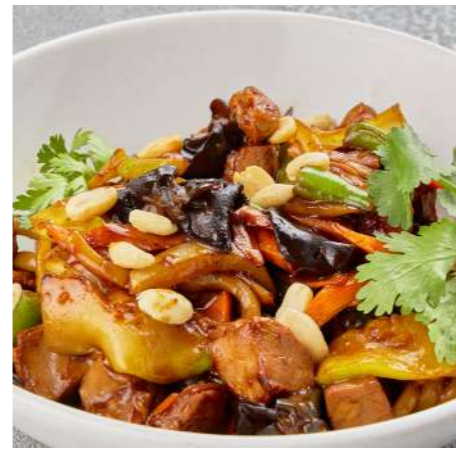
Лапша удон с уткой по-пекински PEKING DUCK UDON NOODLES 乌冬面与鸭