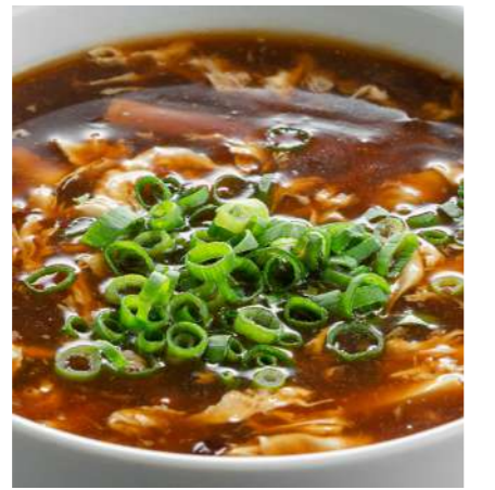
Кисло-острый суп с курицей SOUR-SPICY SOUP WITH CHICKEN 酸辣鸡肉汤