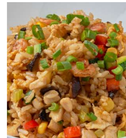
Жареный рис с курицей и креветками FRIED RICE WITH CHICKEN AND SHRIMP 鸡肉大虾炒饭