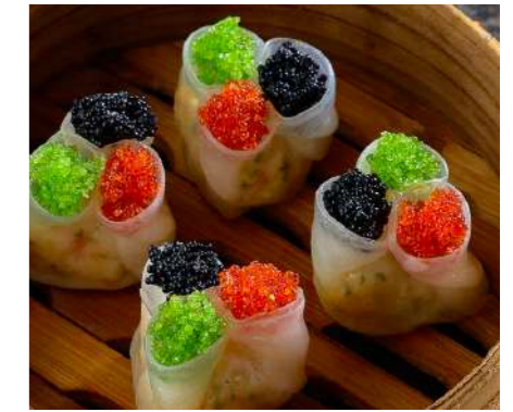
Дим Самы с морепродуктами DIM SUM WITH SEAFOOD 海鲜点心