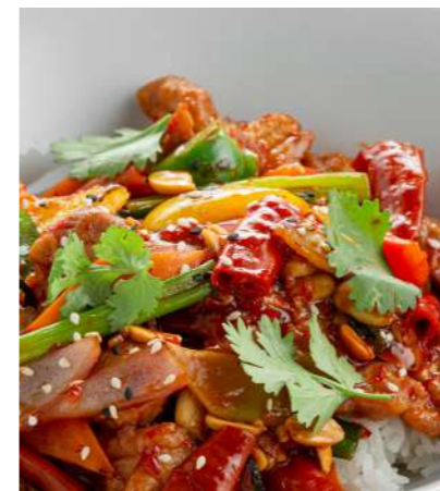
Курица Кунг-Пао KUNG PAO CHICKEN 宫保鸡丁