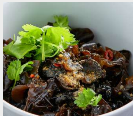
🔥 Дреvesные грибы в 13 специях WOOD MUSHROOMS IN 13 SPICES 木蘑菇在13香料

ЕСЛИ У ВАС ЕСТЬ АЛЛЕРГИЯ НА ОПРЕДЕЛЕННЫЕ ПРОДУКТЫ, ОБЯЗАТЕЛЬНО СООБЩИТЕ ОБ ЭТОМ. VE ALLERGIES TO CERTAIN FOODS, PLEASE REPORT IT.