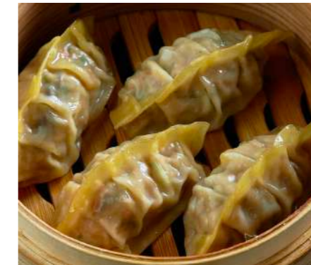
Дим Самы с курицей DIM SUM WITH CHICKEN 鸡肉点心