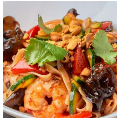
Рисовая лапша с креветками RICE NOODLES WITH SHRIMP 虾米面