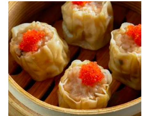
Сюмай со свиной и креветкой XIUMAI WITH PORK AND SHRIMP 秀麦配猪肉和虾