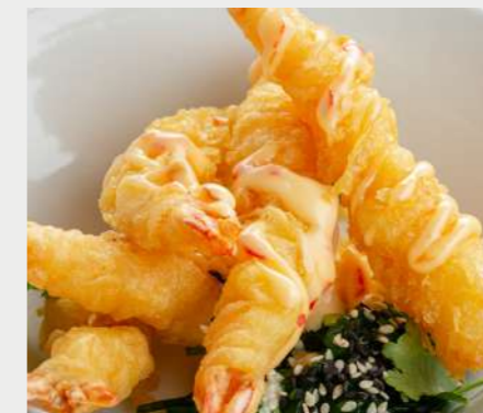
🌊 Креветки темпура TEMPURA SHRIMP 天妇罗虾