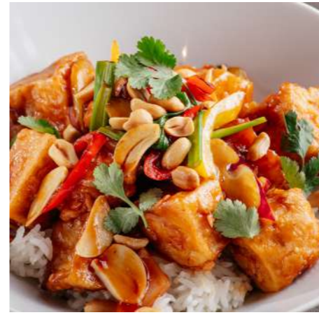
Курица в кисло-сладком соусе с рисом CHICKEN IN SWEET AND SOUR SAUCE WITH RICE 糖醋鸡肉配米饭