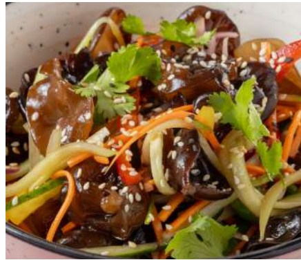
Салат из древесных грибов с хрустящими овощами TREE MUSHROOM SALAD WITH CRISPY VEGETABLES 樹蘑菇沙拉佐脆皮蔬菜