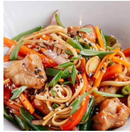
Лапша удон с курицей/с овощами UDON NOODLES WITH CHICKEN/WITH VEGETABLES 乌冬鸡肉/蔬菜