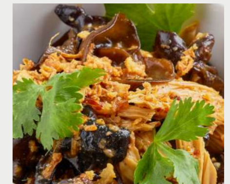
Соевая спаржа с древесными грибами SOY ASPARAGUS WITH WOOD MUSHROOMS 大豆芦笋配木耳