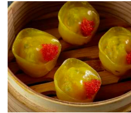
Дим Самы с креветкой и морским гребешком DIM SUM WITH SHRIMP AND SCALLOP 虾仁点和扇贝