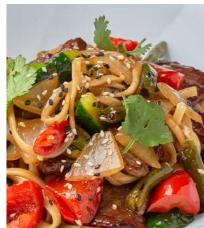
Говядина в устричном соусе с рисом/с лапшой BEEF IN OYSTER SAUCE WITH RICE/NOODLES 蚝油牛肉配米饭/面条