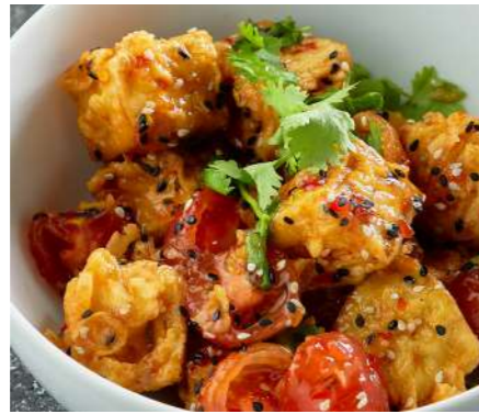
Салат с томатами и баклажанами в китайской темпуре и Sweet Chili Sauce SALAD WITH TOMATOES AND EGGPLANT IN CHINESE TEMPURA AND SWEET CHILI SAUCE 西红柿和茄子沙拉在中国天妇罗和甜辣椒酱